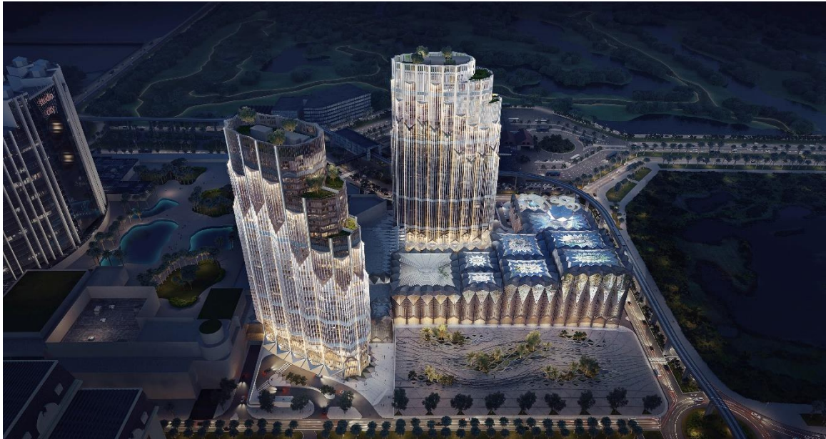
新濠影滙—澳門 W 酒店 – 外觀